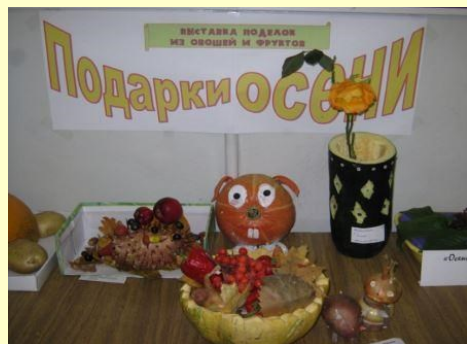
ДОО «Дружба» МОУ Смирновская СОШ

Хочется надолго запомнить это волшебное время года. Ведь оно прекрасно и поблагодарить всех кто принял активное участие, ведь благодаря Вам выставка получилась великолепной!