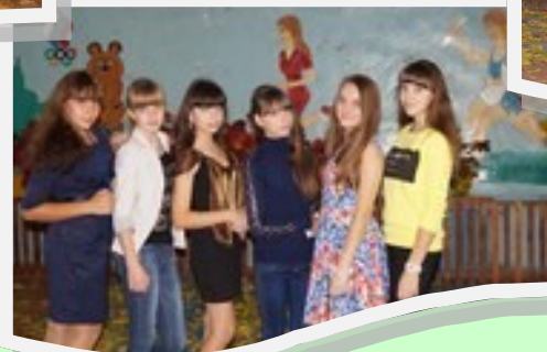
Девочки на осеннем балу.