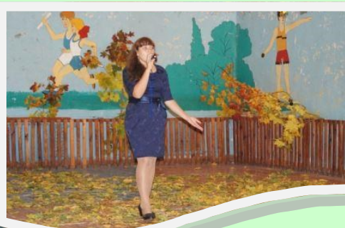
Исполняется песня «Осенний бал»