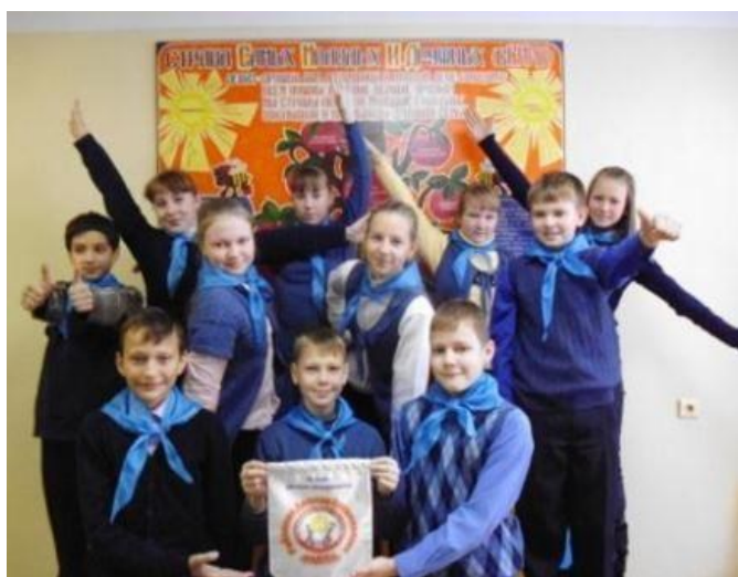
ДОО «страна СМИД»

Теперь каждый день спешу на работу, чтобы снова увидеть своих мальчишек и девчонок, подаривших мне ключики от своих сердец.