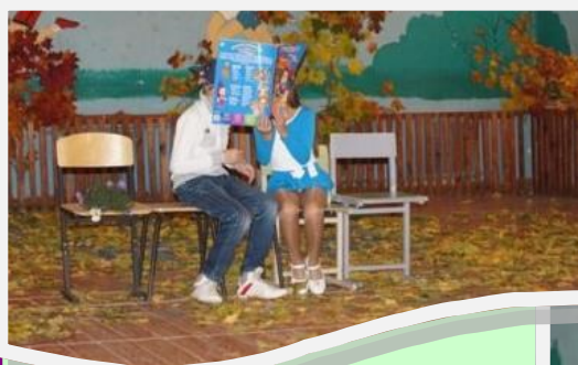
Сценка от 5 класса