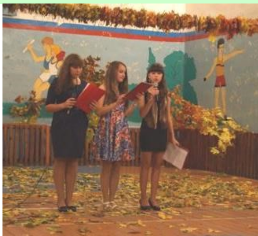
Ведущие загадывают зрителям осенние загадки.

Но вот и наступил вечер. Все пришли празднично одетые. Зазвучала ме-