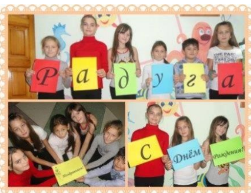
ДОО «Страна СМИД»